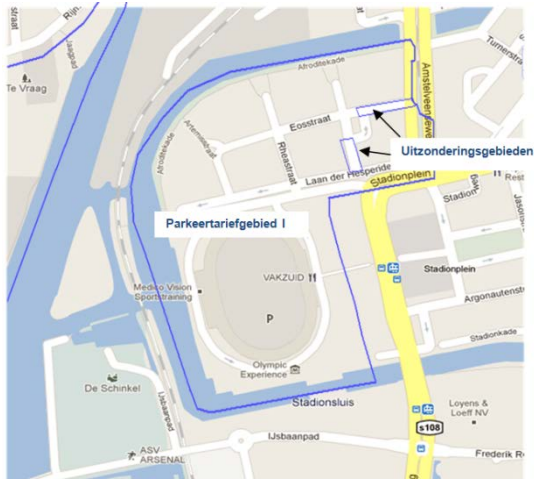
Afb 3: Parkeertariefg gebied met uitzonderingsgebied

Als bepaalde straten een uitzondering vormen op het grote omliggende gebied (uitzonderingsgebied) dan kan deze straat gewoon als gebied het gebruiksdoel worden aangeleverd. Het NPR maakt hierin geen onderscheid.