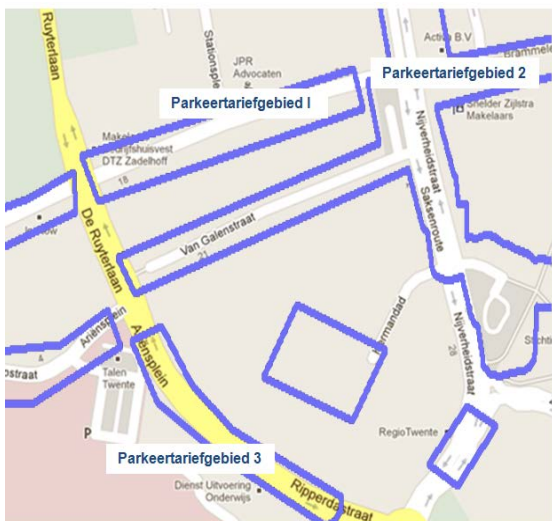
Afb 2: Parkeertarief/vergunninggebieden per straat

Het eerste model is het meest overzichtelijk. Bij het opmaken van grote gebieden die meerdere straten bevatten moet wel rekening worden gehouden dat alle straten in het gebied hetzelfde parkeerregime hebben. Wanneer een straat of gebied een ander regime heeft, dient deze als een apart gebied te worden opgemaakt.